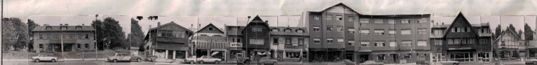
FACHADA VEREDA SUR